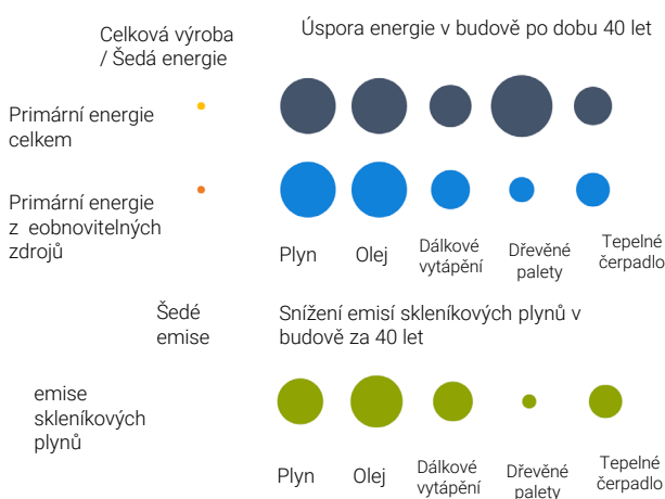
Graf 2: Poměr energetické náročnosti a emisí skleníkových plynů při výrobě izolačních materiálů k úsporám, kterých lze dosáhnout během 40leté životnosti u různých druhů paliv, na základě příkladového výpočtu se zlepšením koeficientu U z 0,8 na 0,24 W/(m 2 ·K)

Výsledky ukazují, že spotřeba primární energie (celková i z neobnovitelných zdrojů) a emise skleníkových plynů při výrobě izolačních materiálů hrají v porovnání s úsporami, kterých lze tímto způsobem dosáhnout, pouze podružnou roli (graf 2).