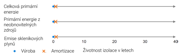
Graf 3: Doba návratnosti v porovnání s životností (40 let) zateplení pro tři sledované environmentální ukazatele na základě příkladového výpočtu se zlepšením hodnoty U z 0,8 na 0,24 W/(m 2 ·K); jako zdroj energie je použit plyn.

Tento poměr je velmi zřetelný také při pohledu na energetickou dobu návratnosti, tedy dobu, po jejímž uplynutí jsou náklady na výrobu izolačního materiálu vyrovnány úsporami, které lze díky němu dosáhnout (graf 3).