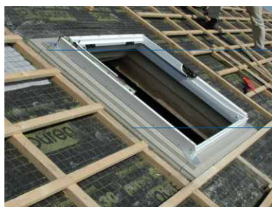
Ober- und Unterseite purenit - veredelt Recyclingprodukt auf PUR/PIR-Hartschaumbasis